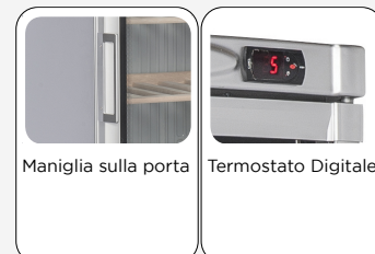
Maniglia sulla porta